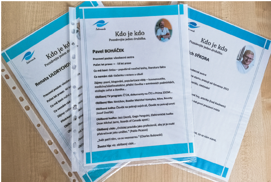
Obr. 3. Ukázka intervence Poznávejme jeden druhého